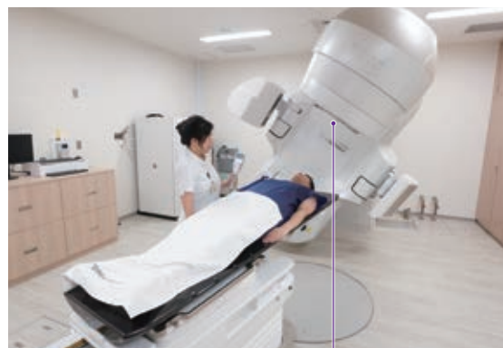
ここから病巣の形に合わせた放射線が出ます