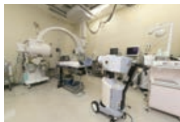
リモートアフターローディング