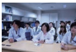
治療計画室でのカンファレンス