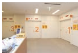
リニアック入口前フロア